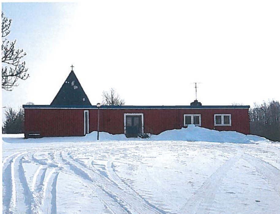
S:t Olofs Kapell, vintern 2017/18

Under året har vägföreningen genom att teckna ett tioårigt hyresavtal bidragit till att förverkliga ombyggnaden av Kapellet i Byxelkrok. Hyra för fem möten om året i tio år har förskottsbetalats med ett belopp om 45 000 kronor.