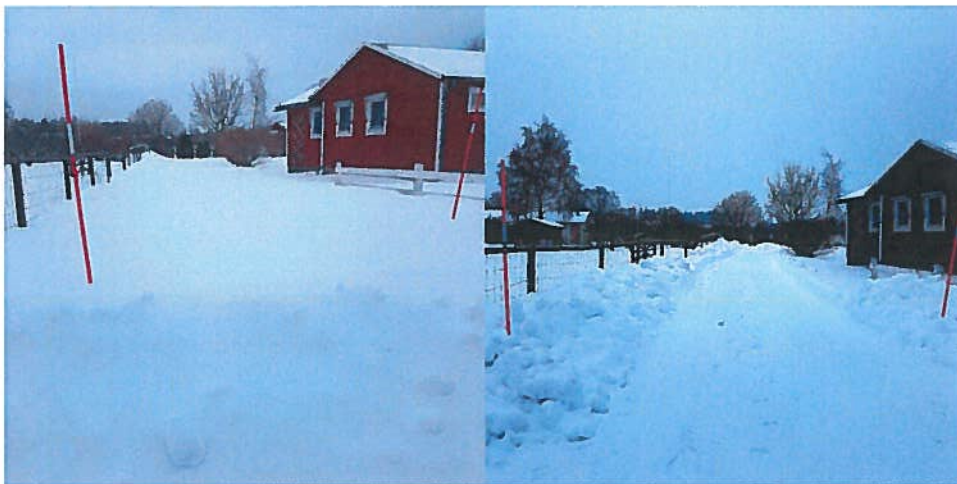
Exempel på underhållsarbete. Snöröjning hos fritidshusboende på Kortvägen. Före och efterbild.

Under året har Sickelsgatan sträckning mot Vattenverket asfalterats. Genvägen har grusats upp. Planerad ny toppning på Fiskväg och asfaltering av vändplanen på Östra Gatan har ej kunnat genomföras på grund av fibergrävningen. Underhållsarbetet genomförs under 2018.