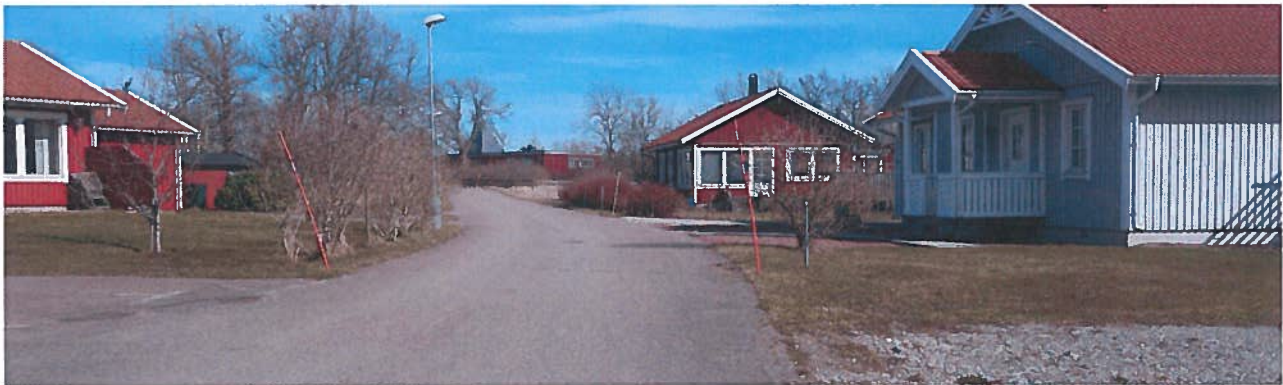
St Olofs väg

Vägföreningen förvaltar ca 18 kilometer väg fördelat på ca 60 vägar i Byxelkrok. Största delen av vägnätet har asfaltsbeläggning.