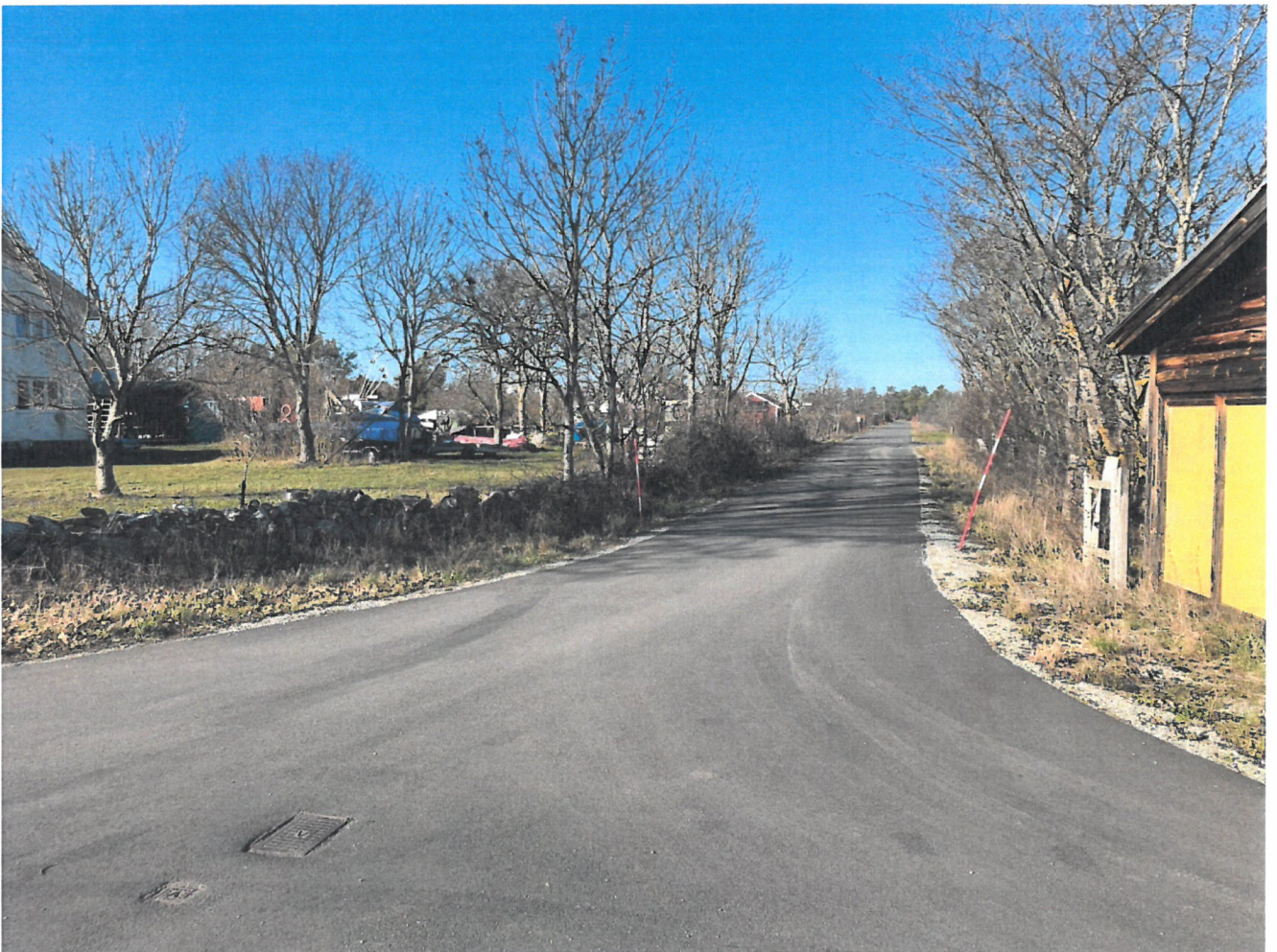
Enemarksvägen södra delen våren 2020