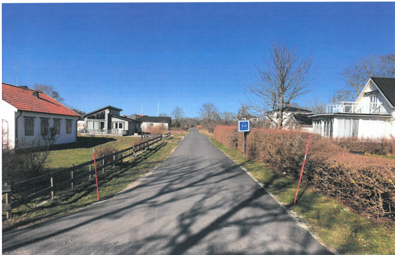
Äskhorvegatan våren 2020

Under året har några kompletterande fiberanslutningar gjorts i Byxelkrok. Det har lett till en handfull övergrävningar. Vi har så långt haft en bra dialog med fiber-entreprenörerna. Under slutet av sommaren 2020 ska en garantibesiktning genomföras, avseende de reparationer som gjorts i vårt vägnät. Även Borgholm Energi AB och E.ON har utfört arbeten på sina ledningar och återställt skador på vägnätet de orsakat.