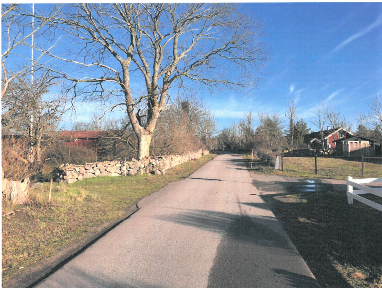
Svältergatan våren 2020

Avgiften per andel fastställs årligen på föreningens årsstämma. Andelspriset om 160 kr/andel och år har varit oförändrat sedan 2013. Styrelsen planerar för ett oförändrat andelspris de närmast åren.