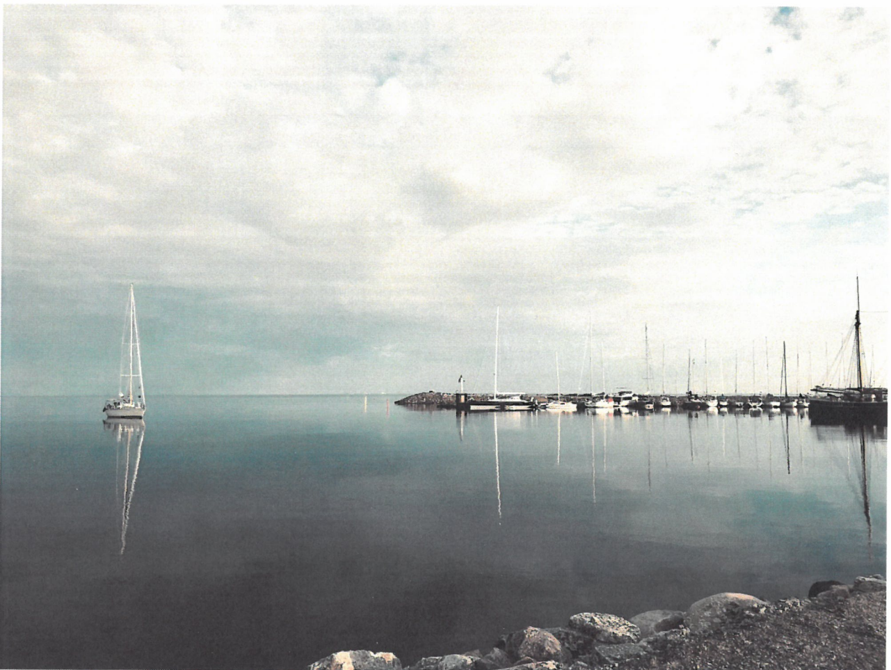
Byxelkroks hamn sommaren 2019