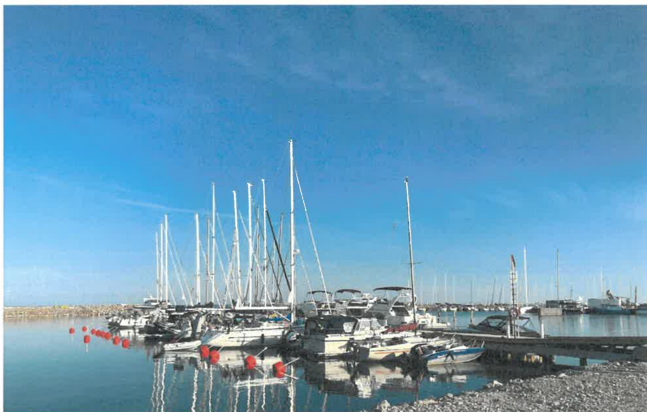
En sommardag i hamnen