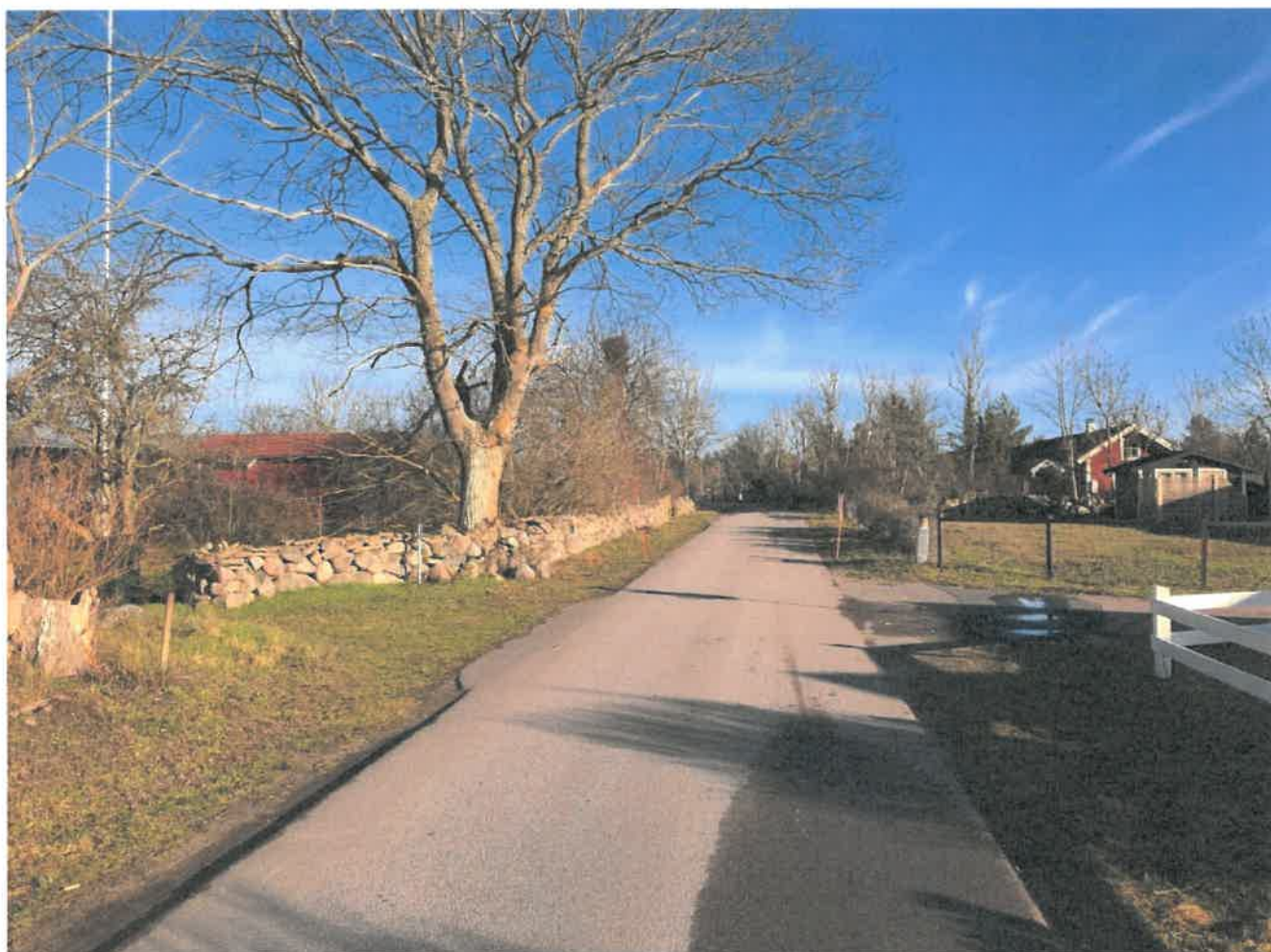
Svältergatan norra delen

Avgiften per andel fastställs årligen på föreningens årsstämma. Priset om 160 kr/andel och år har varit oförändrat sedan 2013. Styrelsen planerar för ett oförändrat andelspris de närmaste åren.