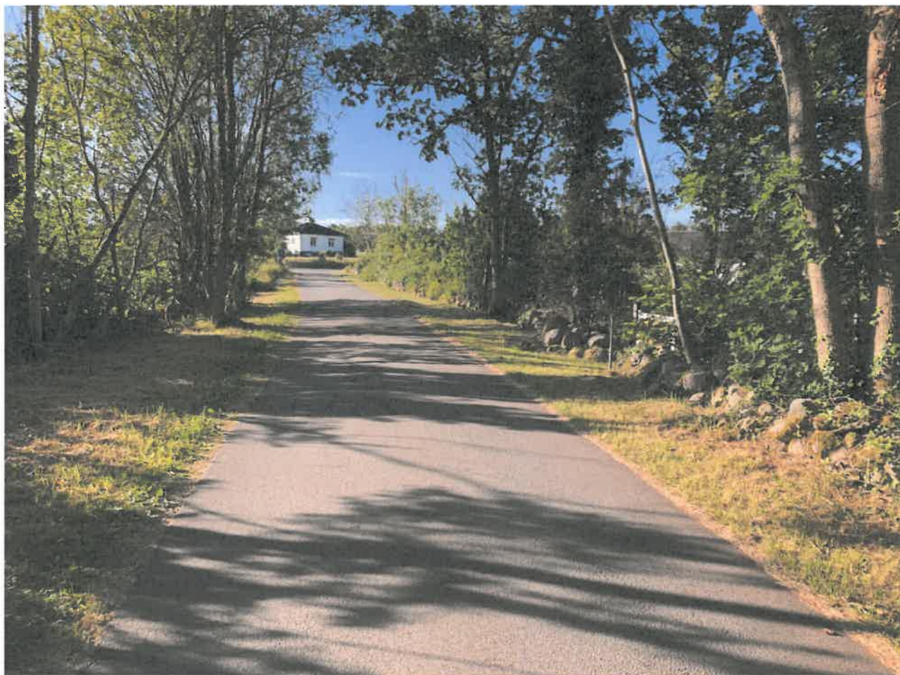
Södra delen av Svältergatan

Under året har kompletterande fiberanslutningar fortsatt inom vårt vägområde. Det har lett till en handfull övergrävningar. Vi har så långt en bra dialog med fiber-entreprenörerna. Under slutet av sommaren 2020 genomfördes en garantibesiktning varvid några asfalts-reparationer gjordes om. Även Borgholm Energi och E.ON har utfört arbeten på sina ledningar och anslutit nya fastigheter till sin infrastruktur.