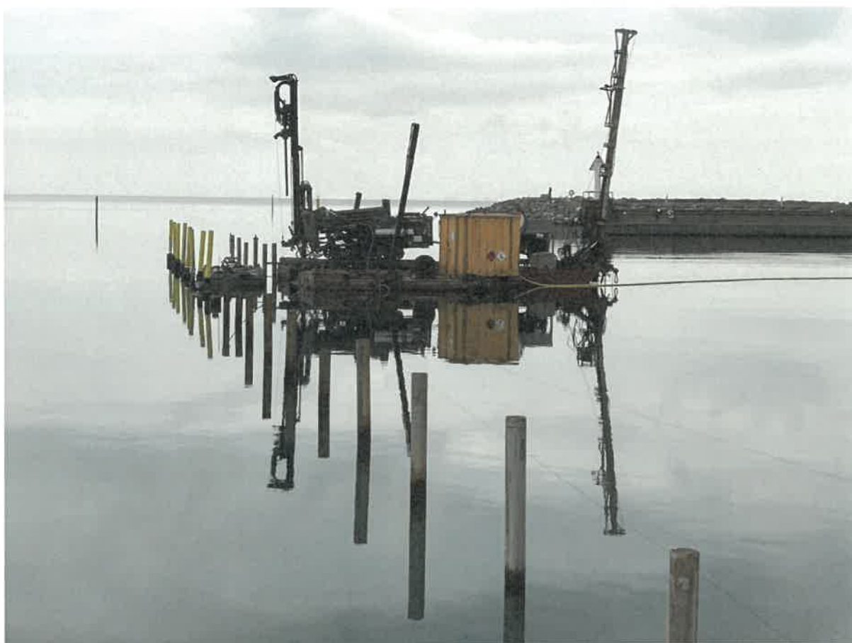
Arbete med norra bryggan i Byxelkroks hamn hösten 2020